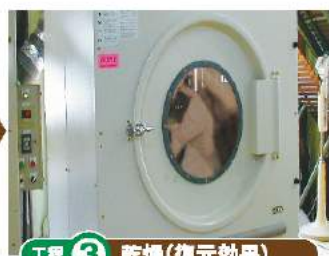
工程 ③ 乾燥(復元効果)