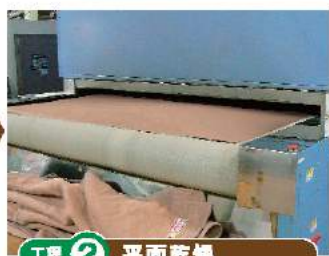
工程 ② 平面乾燥