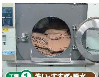
工程 ① 洗い・すすぎ・脱水