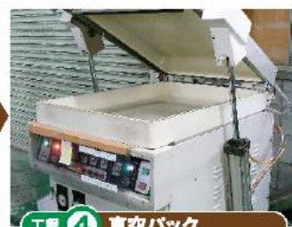
工程 ④ 真空パック