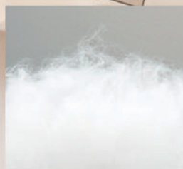
ポリエステルわた