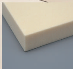
ウレタンフォーム