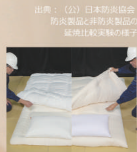
防災製品と非防災製品の 延焼比較実験の様子