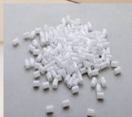
ポリエチレンパイプ