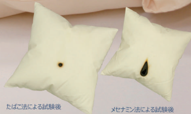
たばこ法による試験後