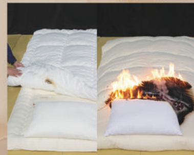
着火スタートから42分後